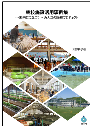
写真1 廃校施設活用事例集表紙 1)