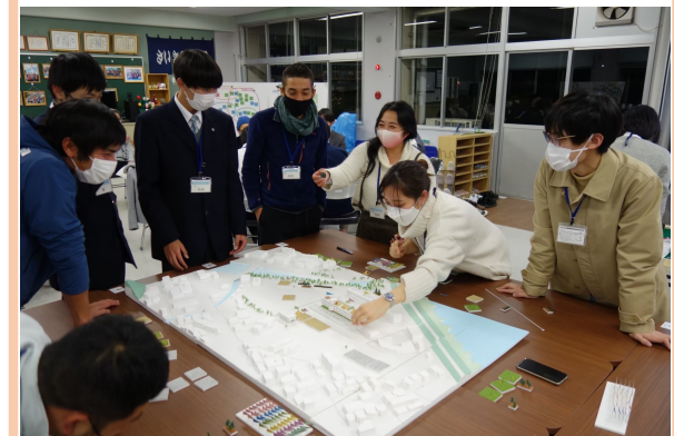
写真3 第3回ワークショップの様子