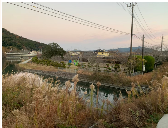
写真2 対象地周辺の様子